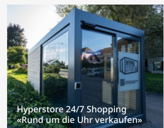
Hyperstore 24/7 Shopping «Rund um die Uhr verkaufen»